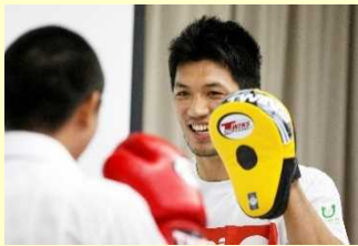
トッパスリートによる少年院訪問の様子