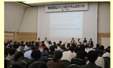
再犯防止シンポジウムの様子