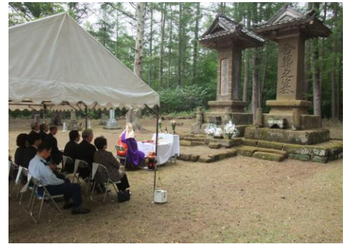
今でも続く北山墓地慰霊祭の様子