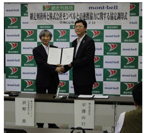
地域包括連携協定調印式

地域社会との共生も刑務所の大きな役割であるところ、既にアウトドアを通じた地域活性化に向けた取組を行っているモンベル社と連携することで、今後、オホーツク地域の活性化に一層寄与していきたいと考えています。