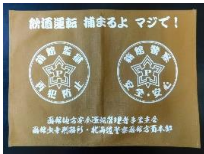
飲酒運転根絶啓発ランチョンマット

・函館少年刑務所では、地域社会と連携する取組の一環として、令和2年7月、「飲酒運転根絶の日」に合わせ函館地方安全運転管理者事業主会及び北海道警察函館方面本部等と協力し、飲酒運転根絶啓発ランチョンマットを作成しました。