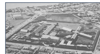
函館刑務所→函館少年刑務所

明治2年 開拓使出張所開庁，庁内に徒刑場を設置 明治36年 函館監獄と改称 大正11年 函館刑務所と改称 昭和2年 現在地に移転 昭和18年 函館少年刑務所と改称 昭和22年 鱒川農場新設 昭和39年 総合職業訓練施設に指定 昭和62年 全体改築工事着工 平成15年 鱒川泊込作業場を通役作業に変更 平成17年 新川拘置支所廃止 平成18年 全体改築工事完了