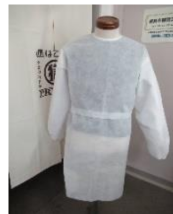
令和2年5月作成 アイソレーションガウン

・函館少年刑務所では、新型コロナウイルス感染症の感染拡大に伴い、厚生労働省等からの依頼を受け、令和2年5月から同9月までの間、約4万着の医療用アイソレーションガウンを生産しました。