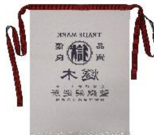
令和2年8月作成 前掛け