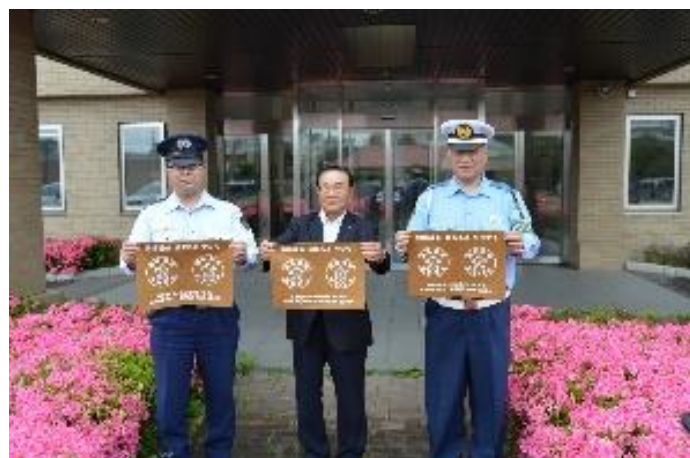
函館少年刑務所×函館地方安全運転管理者事業主会×北海道警察