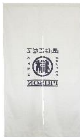
令和2年8月作成 暖簾

・函館少年刑務所では、マル獄シリーズとして、カバンなど丈夫で長持ちする製品を平成18年から製作しており、全国でも人気商品になっています。