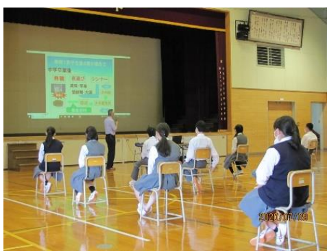
学校での薬物乱用防止教室