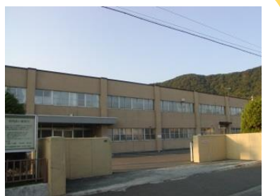
藻岩山麓の旧庁舎と運動場内壁画