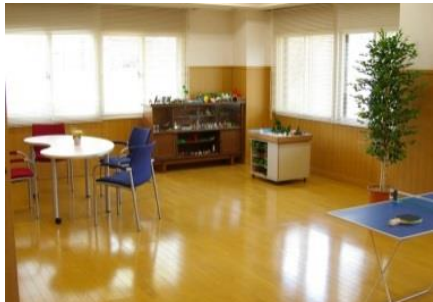
和やかな雰囲気のパレイルーム

一般家庭の父兄の方や学校等の関係機関から、非行に関する悩み事や、家庭・学校での問題行動など、 青少年の健全育成に係る相談を受けています。 相談内容、ニーズに応じて、適切な対応等について提案し、支援を行います。