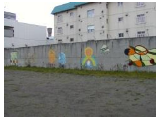
新施設竣工後の様子