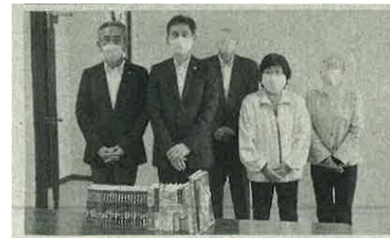
保護司会の方々と支所長

本年9月、保護司会の方々から図書34冊の寄贈を受けました。御厚意に深く感謝いたします。今後も地域の皆様と手を携えながら、少年たちの健全育成のため頑張ってまいります。