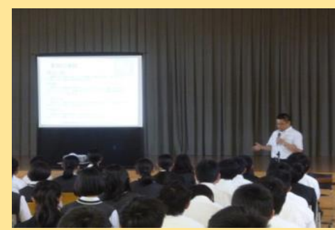
学校での講演の様子