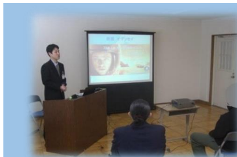
宇宙に関する講話

私たちは、 在所者の健全育成のため、様々な取組を行っています 。ここに紹介するのは、その一例です。