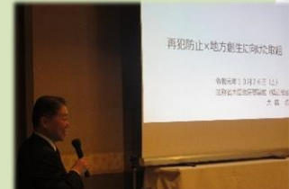
法務省大臣官房審議官