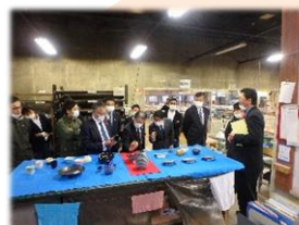
網走バイオマス 発電所