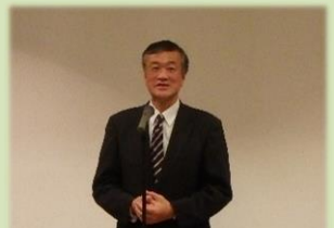
網走市長 水谷洋一 氏