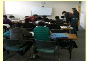
BBS会員と法務少年支援センターの連携による学習支援の様子

矯正施設における復学手続等の円滑化等のため学校と矯正施設等との連携事例を学校関係者等に周知