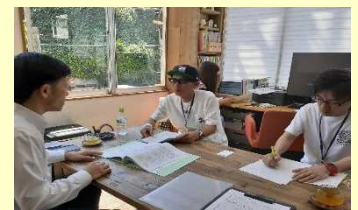
長崎ダルクへの訪問の様子