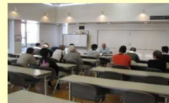
更生保護施設の処遇の様子