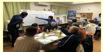
特定非営利活動法人による社会内問題回復プログラム実施の様子