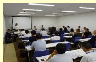
コレワークによる雇用支援 セミナーの様子