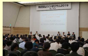
再犯防止シンポジウムの様子