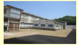
老朽化した刑事施設の外観の様子