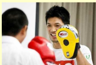
トップアスリートによる少年院訪問の様子