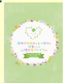
薬物依存症をもつ家族支援のワークブック