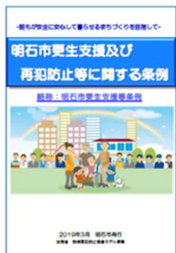
全国初の更生支援に関する条例を制定

市民の再犯防止・更生支援に対する理解を促進し、支援の輪を広げることにより、更生支援の取組みを安定的・継続的に継続するため、広報・啓発活動等を実施。