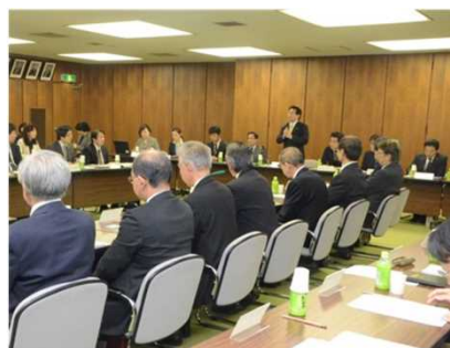
37の関係機関でネットワーク会議を開催