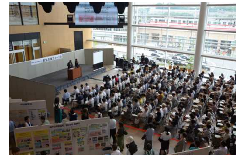
啓発イベントでは参加者の99.3%が自治体が更生支援に取り組むべきと回答