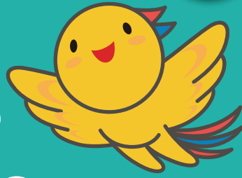
兵庫県マスコット「はばタン」