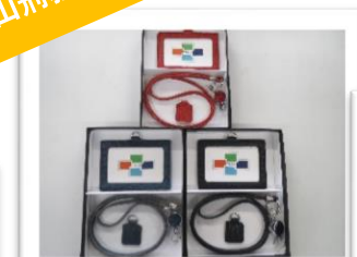
リール付IDカードホルダー