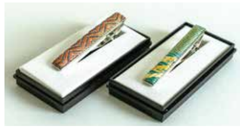
鳥栖市ふるさと納税謝礼品 「佐賀錦タイピン2点セット」 (平成30年度末から採用)