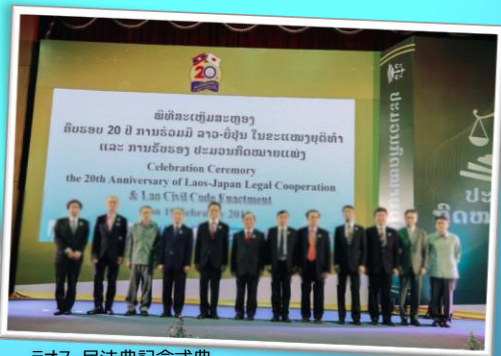
Laos・民法典記念式典