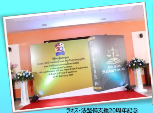
Laos・法整備支援20周年記念