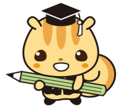
法教育マスコットキャラクター ハウリス君

児童や生徒を対象に、少年司法手続の流れ、非行・犯罪（薬物乱用、暴力、万引き等）の防止などについて分かりやすく説明します。