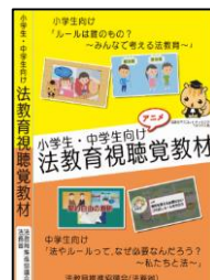
小・中学生向け視聴覚教材