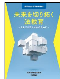
高校生向け冊子教材