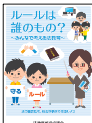
小学生向け冊子教材