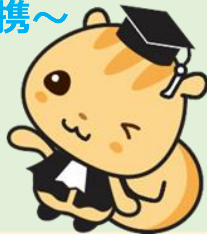
法教育マスコットキャラクター 「ハウリス君」