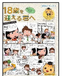
高校生向けリーフレット