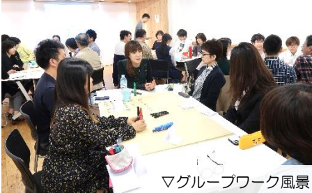
▽グループワーク風景