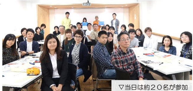
▽当日は約20名が参加

授業終了後には、参加者から「刑務所について、初めて知ることばかりで大変興味深かった」というお声をいただきました。