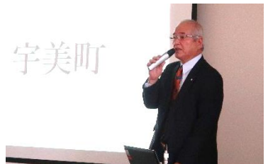
▽福岡県宇美町木原忠町長による取組紹介

質問やご意見、取り上げてほしい事項などありましたら、当課までお気軽にご連絡ください。