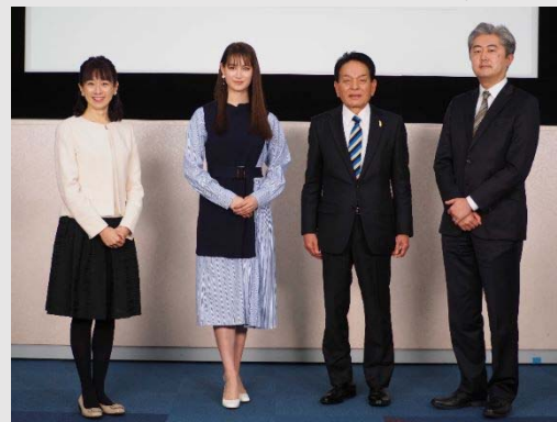
配信後の様子@法務省

本イベントの様子などは、YouTube法務省チャンネル（以下のQRコードからアクセスできます）で配信しますので、当日見逃された方も是非御覧ください。