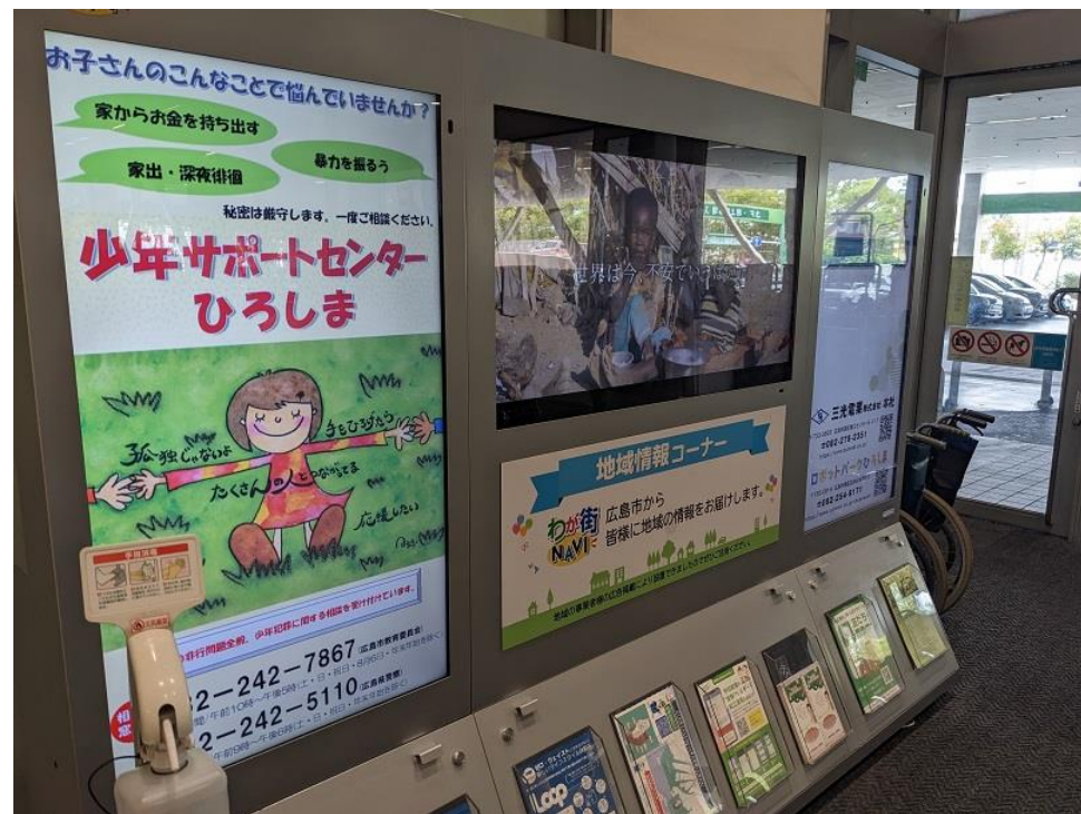
「わが街NAVI」イオン宇品店 インフォメーションパネル

非行少年の立ち直りを支援するため、課題を抱える中学校等に県警察スクールサポーターを派遣し、生徒や教員等に対して助言、指導を行う。