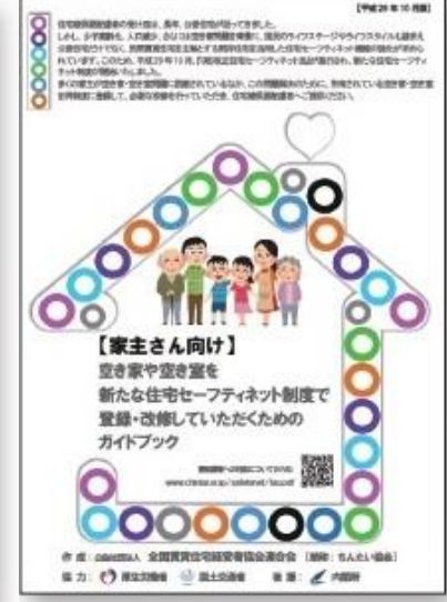
【家主さん向け】 生活保護受給者 入居ガイドブック 【家主さん向け】 生活困窮者の 入居ガイドブック 【家主さん向け】 高齢者の入居 ガイドブック