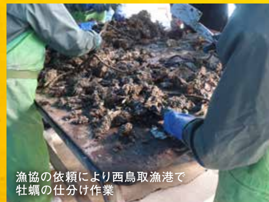
漁協の依頼により西鳥取漁港で牡蠣の仕分け作業