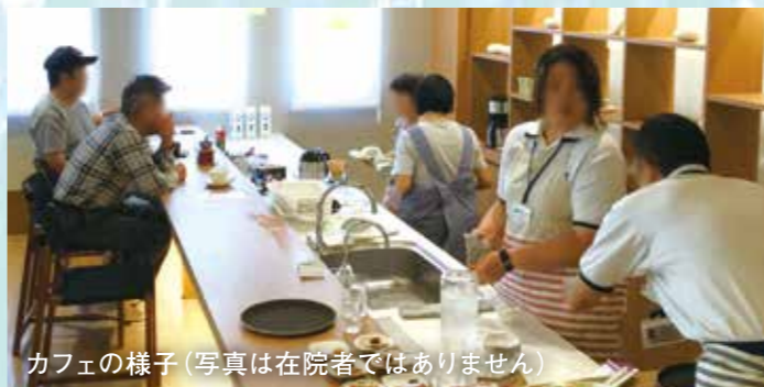
カフェの様子(写真は在院者ではありません)

近隣にある特別養護老人ホームで開催されている入所者、施設職員、地域住民らを対象とした交流イベントのカフェに、社会貢献活動の一環として在院者が参加。年に2、3回ほど、在院者をカフェに派遣し、食器洗いやお菓子の配膳のお手伝いを実施します。その中で、働いているスタッフの方の姿を見て、介護職への興味や関心を持った在院者もあり、参加者にとっては今後の対人関係や出院後の進路を考える契機にもなっています。参加するたびに、スタッフやボランティアの方、そしてご利用の方に「ありがとう。」「助かるよ。」と温かい言葉をいただいています。