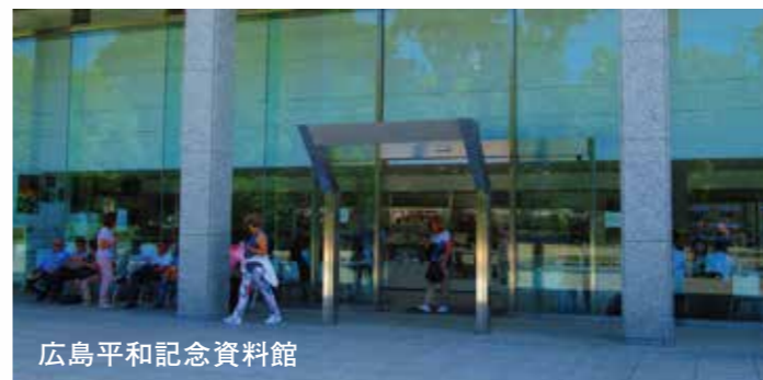
広島平和記念資料館

折鶴再生紙を利用した平和の折鶴・缶バッジの製作を通して『国際平和文化都市ヒロシマ』として平和と文化の調和を発信。職員や受刑者が原爆被害を受けた過去を振り返り、平和への願いを込めています。資材となる再生紙は、平和記念公園内の『原爆の子の像』に対し国内や海外から捧げられた折り鶴(年間約1千万羽、重さ約10トン)。当所では、この思いのこもった折り鶴1つ1つを身近なものに昇華させるため、折鶴再生紙として新たな命を吹き込みました。この取組は、平和と文化の地域活性プロジェクト from HIROSHIMAの一端を担っています。