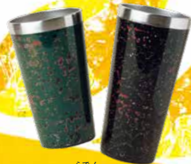
らでん 津軽塗螺鈿タンブラー

津軽塗は加工の難しさや経済的な理由から担い手が減少する中、刑務作業を通じて伝統工芸を伝承していければと始めました。刑務所の中にも社会とのつながりを感じることのできる、受刑者のやる気が特に高い作業の1つです。