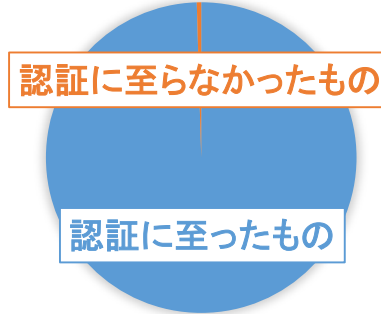
認証／非認証の件数