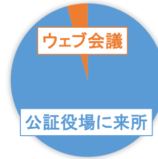
面前確認を受けた方法