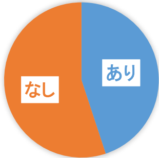
定款案への指摘の有無