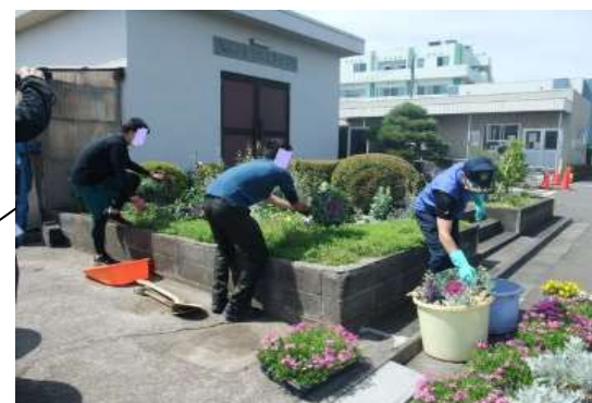
在院者による市営霊園の花壇整備