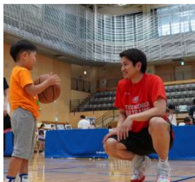
プロバスケットボール選手との交流