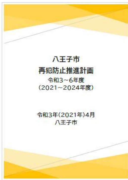
八王子市再犯防止推進計画(R3～R6)