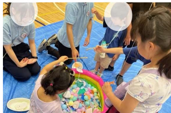
八王子BBS会による更生保護キャラクターの釣りゲーム