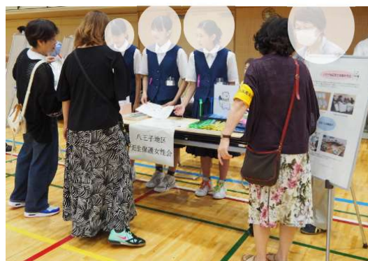
市内中学生と更生保護団体との交流