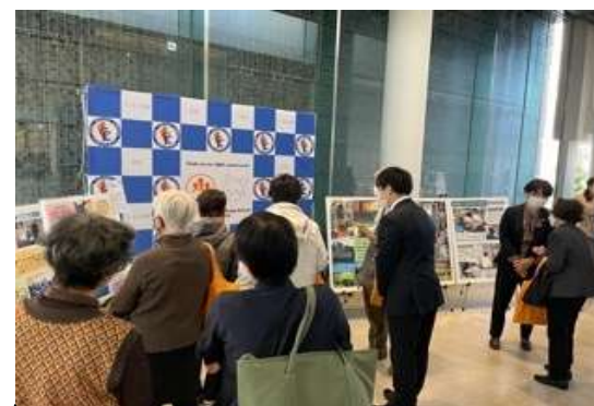
市イベントで多摩少年院の活動紹介