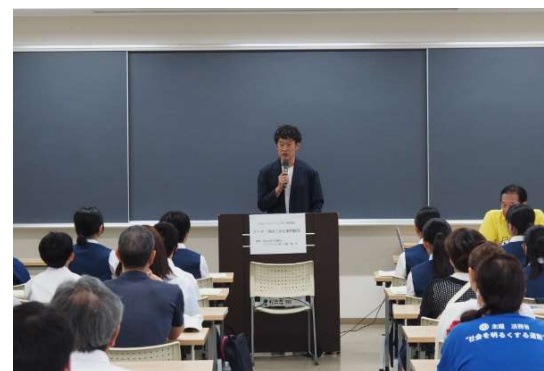
八王子ダルクの特別授業