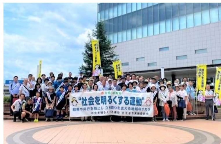
社会を明るくする運動 活動の様子