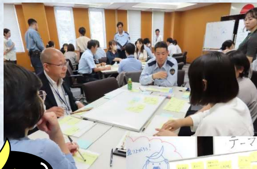
ワークショップの様子

参加された自治体職員の方からは、「 施設見学を通じて再犯防止を身近に感じることができた。 」などの好意的な感想が多く聞かれ、また、宮城刑務所職員にとっても、普段は塀の中の業務で、なかなか外部の方の声を聴く機会がないことから、大変有意義な時間となりました。