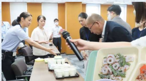
試食体験の様子 刑務所ご飯の代表格、「麦飯」も！