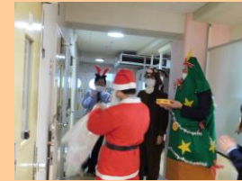
【クリスマス会の様子】