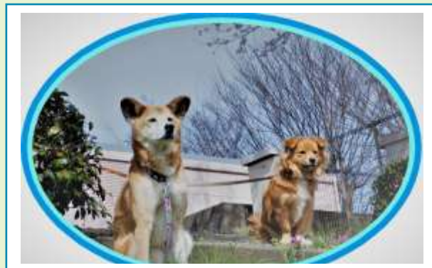
更生支援パートナー犬「ハル」「メイ」

関東・甲信越及び静岡地方の家庭裁判所又は裁判所において審判若しくは裁判により、保護処分又は刑の執行を受けるため少年院送致決定を受けた14歳以上、20歳未満の女子少年を収容する国の施設です。