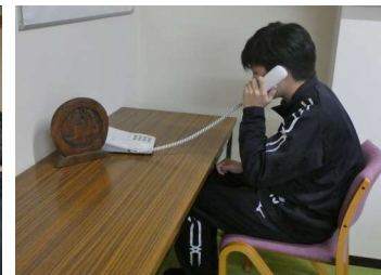
ふれあい家族（電話による通信）