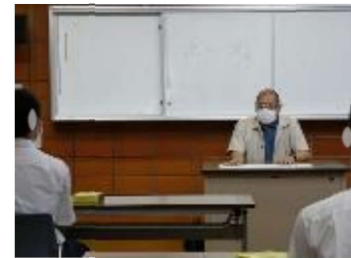
地元工業会会員企業の講話