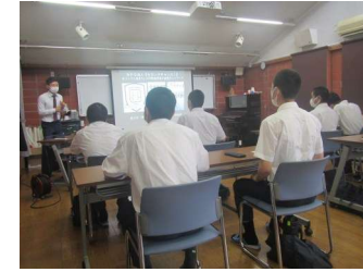
少年院出院者自助団体の講話