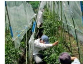
製品企画科アグリコース