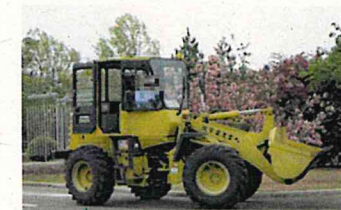
大型特殊建設機械の免許等を取得する3か月のコース