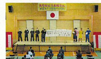
一日お母さんの会