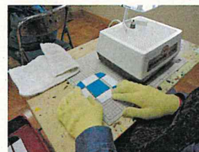
製品企画（クラフト）