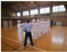
(3級時の集団行動訓練)

院生活における基本的な行動様式や心構え、礼儀作法及びマナーを身につけさせるとともに非行に至った原因、自分の問題点に気付かせます。