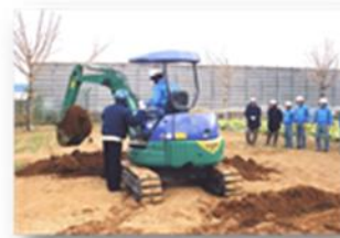
(小型車両建設機械運転特別教育)

働くことの尊さを学び、職業に対する知識、技能及び体力を身につけ、職業生活をする上での心得などを身に付けます。（農園芸コース、手工芸コース、サービスコース、資格取得講座（小型車両建設機械運転特別教育、危険物取扱者試験）ほか）