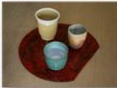
(手工業コース作品)