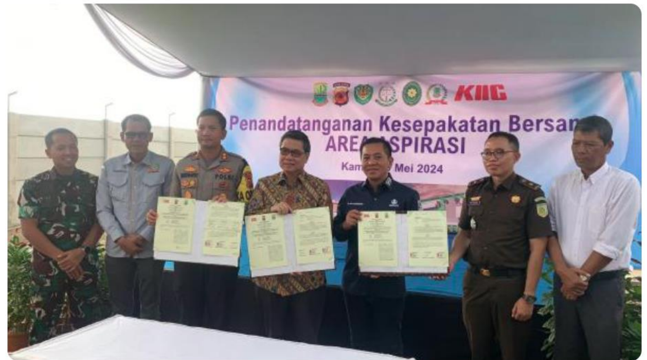
Karawang Regency Government and KIIC Build the First Aspiration Area in Indonesia