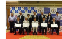
昭島市との防災協定締結