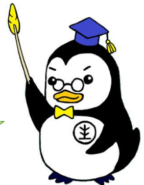
更生ペンギンのホゴちゃん

法教育の一環として、保護観察官や保護司による出前授業も可能です。詳細は、最寄りの保護観察所にお問い合わせください。