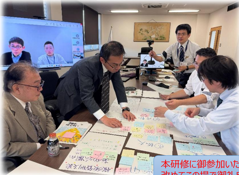
▲静岡・神奈川グループ