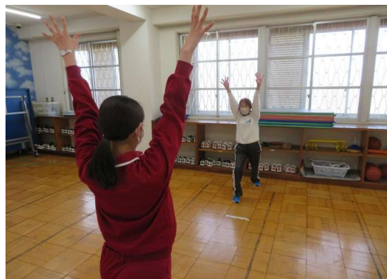
エアロビで気分爽快！