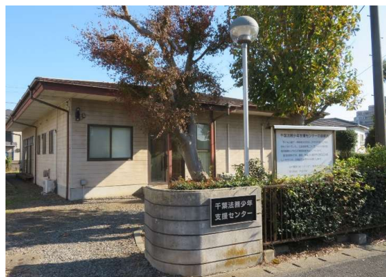
御連絡お待ちしております！