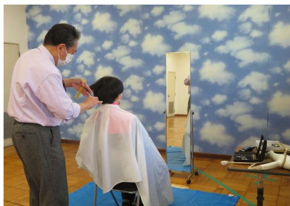
理髪でサッパリしました！