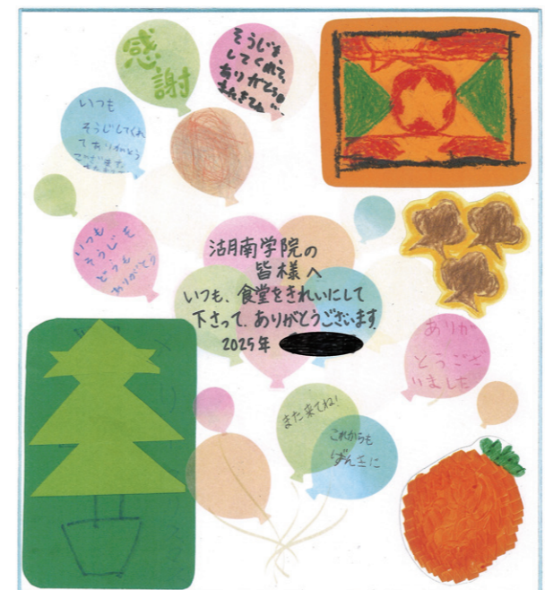
湖南学院:社会福祉施設からの御礼の色紙