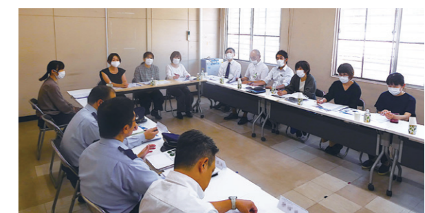
金沢刑務所:関係機関との意見交換会