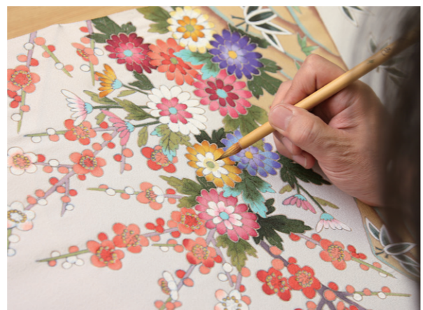
加賀友禅の彩色作業の様子