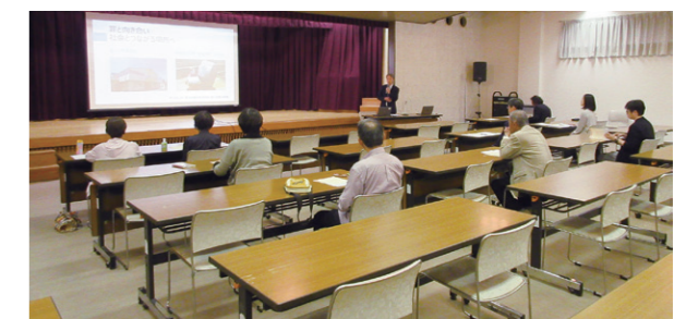
金沢少年鑑別所:青少年健全育成研修