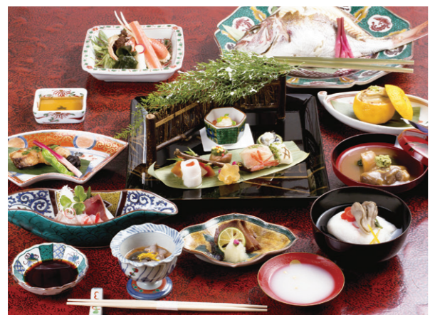
「加賀料理」 令和7年12月に国の登録無形文化財に登録