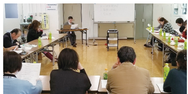
地域の身近な福祉相談窓口研修の様子