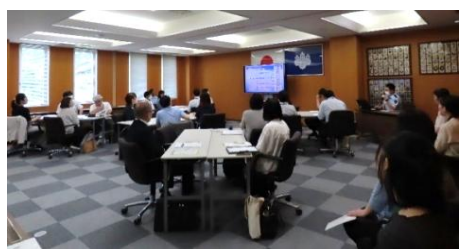
宮城県による市町村再犯防止担当者向けの勉強会@宮城刑務所 (R7年度)

「地方再犯防止推進計画を策定することになったが、何から始めるべきかわからない...」ということについても、遠慮なくご相談ください。