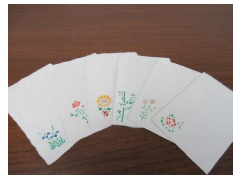
石州和紙はがきセット (作業製品)