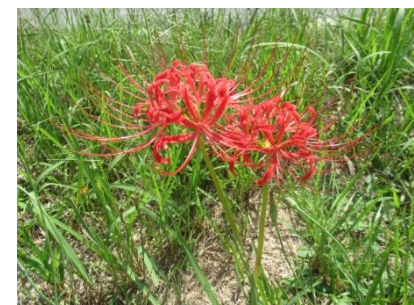
地域の方たちと植栽した彼岸花