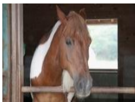
ホースプログラム

・官民協働の施設として、民間事業者のアイデアやノウハウを活用しつつ、国と民間事業者が協力することで、相互の持ち味を活かして、より効果的かつ効果的な矯正処遇を行っています。 ・複数の動物介在プログラムを開設しています。第1期事業から継続してのホース（馬）プログラム、第2期事業から新たにPR犬育成プログラム、保護猫プログラムを実施予定です。それぞれ近隣の関係機関、団体等の協力をいただいています。