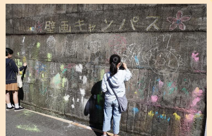
ひろこうフェスタ