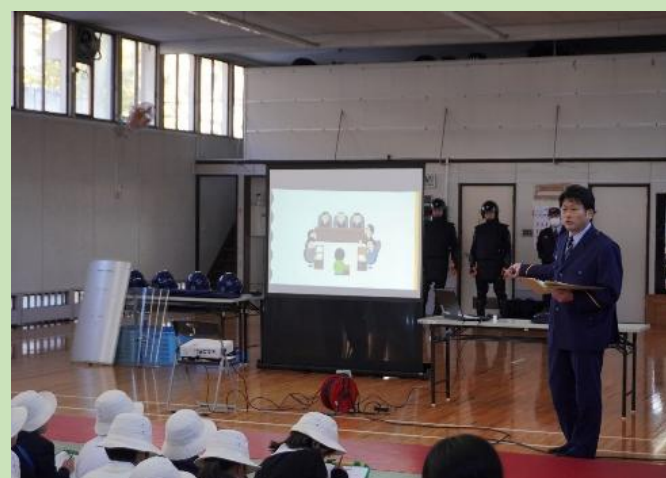
近隣教育機関への取り組み