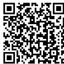
東北地方整備局 住宅セーフティネット制度のページ