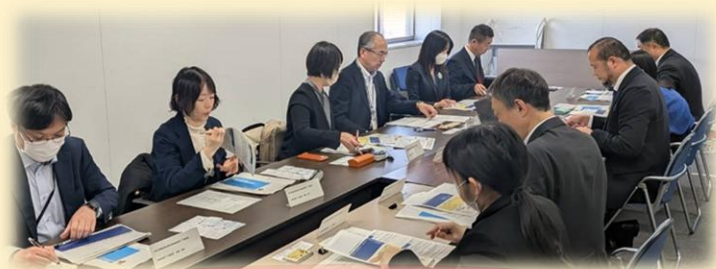
▲居住支援等に係る各省庁情報交換会の様子(R8.4実施)