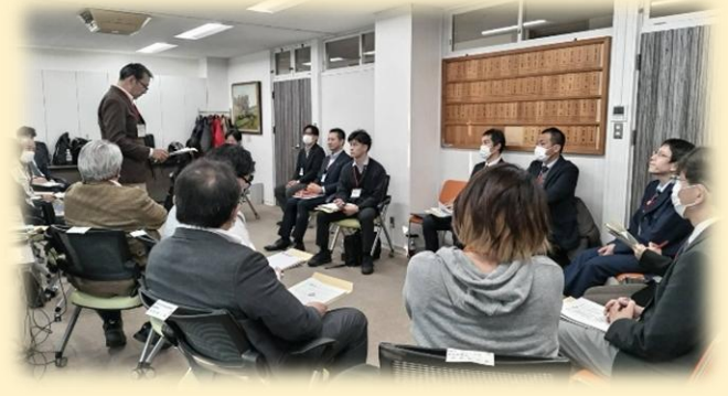
▲昨年度の居住支援協議会等との意見交換会の様子 (山形刑務所(左)、盛岡少年刑務所(右))