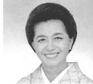
市田 ひろみ (いちだ ひろみ) 服飾評論家 エッセイスト