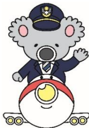
名古屋入管公式マスコット なごみん