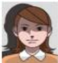
Photos with shadows