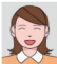
Facial expression is clearly different than normal