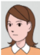
Looking to the side