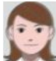
Difficult to see due to blurring, etc.