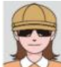
선글라스나 모자를 착용한 것