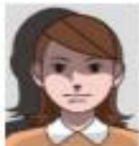
음영이 있는 것