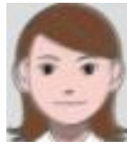
손떨림 등으로 인해 잘 보이지 않는 것