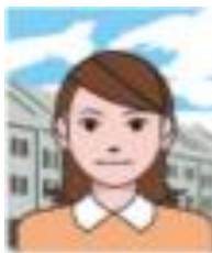
Ada latar belakang