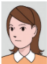
Wajah menghadap ke samping