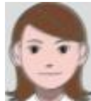
Foto sulit dikenali karena guncangan tangan, dll.