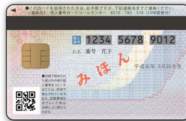
На обороті картки