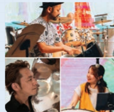
WAIWAI STEEL BAND

世界には様々な音楽があり、各国の文化と歴史が表現されています。トリニダード・トバゴ共和国にてドラム缶から作られた楽器スティールパンを使った演奏と西アフリカの伝統的なドラム、歌、ダンスによるアフリカン・パフォーマンスで会場を楽しく陽気な雰囲気に!