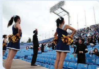
東京大学運動会応援部