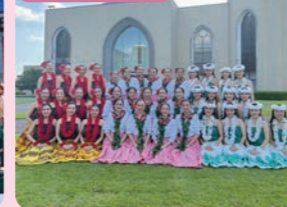
青山学院大学フラスカール Uluwehi