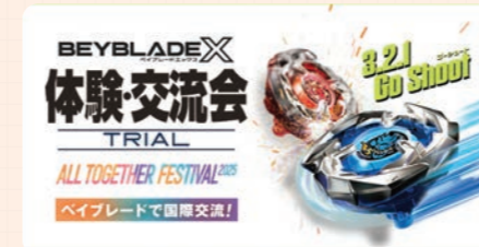
協力: 株式会社タカラトミー

世界中で人気のBEYBLADE Xがオール・トゥギャザー・フェスティバルに登場! ベイブレードを使って交流体験ができます。会場には海外版の展示も! 3.2.1 Go Shoot!