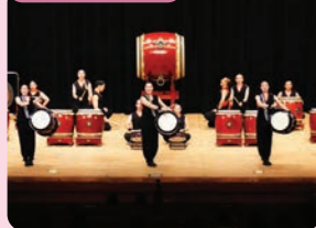
明星学園高等学校和太鼓部