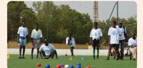
協力団体: 一般社団法人 WITH PEER

ヨーロッパで生まれたパラリンピック正式種目「ポッチャ」を通じて多文化交流!手軽に参加可能です。ぜひご家族でお越しください!