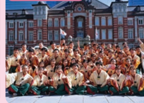
東京学生“生っ粋”とその愉快的仲間たち