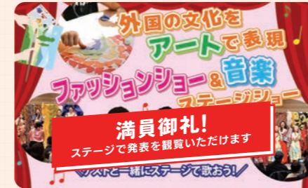
協力団体: World Art Trip (一般社団法人 Little Artists League)

お子様が好きな国をファッションと音楽で表現する2部構成のプログラム。ステージでは川平慈英さん、平澤智さん、HideboHさんと共演します!