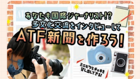
協力団体: PEACEis____プロジェクト

戦場フォトグラファー青木弘さんと一緒に会場を回り、新しい視点を学べる親子参加型プログラムです。