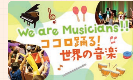
協力団体: 音楽ワークショップ・アーティストおとみく (一般社団法人IROHAMO)

さまざまな国の音楽や楽器をご紹介します!色んな音の響きに出会いながら、一緒にシェーカーやスカーフを使って世界の音楽を楽しみましょう!