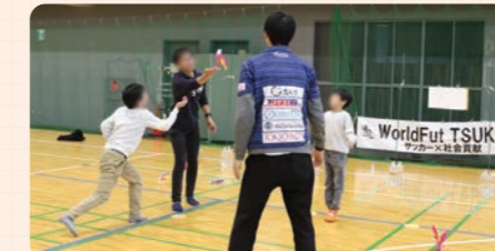
協力団体: 筑波大学公認学生団体WorldFut TSUKUBA

カンボジアで遊ばれている「サイ」というシャトルを使ってゲームを行います。子供だけでなく大人も参加できる遊びとなっております。