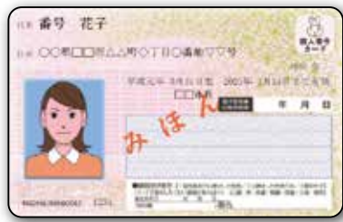
सामने की ओर

सामने की ओर: नाम, पता, जन्म तिथि, लिंग, सामने देखने वाला आपकी तस्वीर, वैधता अवधि पीछे की ओर: व्यक्तिगत नंबर