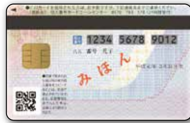
पीछे की ओर