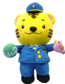
大阪出入国在留管理局 マスコットキャラクター えんトラくん

リンク→ https://yoyaku-osakaimmigration.revn.jp/