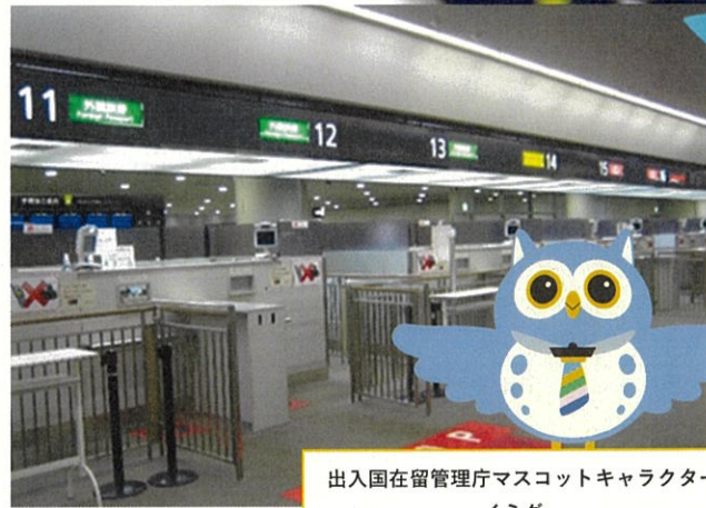
出入国在留管理庁マスコットキャラクター イミグー