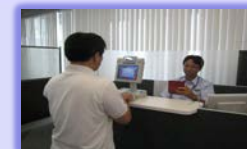
③ 入国審査・上陸許可