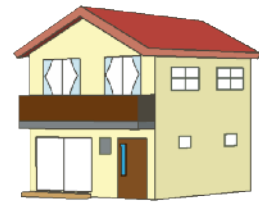
いっこだ いっけんや 一戸建て・一軒家