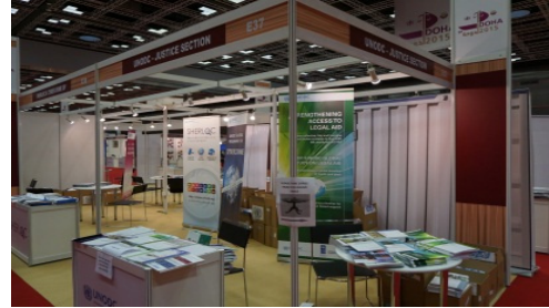
カタール政府の展示ブース