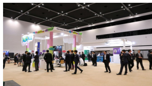
京都国際会館の新ホール