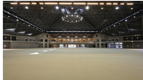
京都国際会館のイベントホール