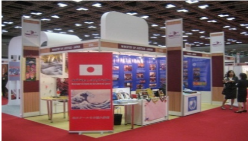
日本政府の展示ブース