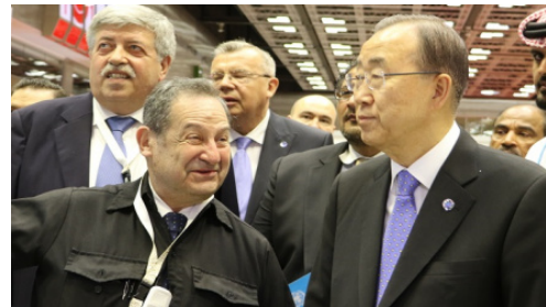
国連事務総長らの展示視察