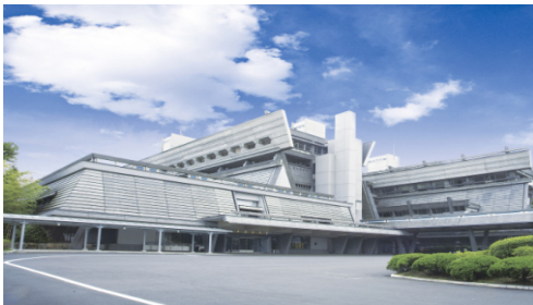
京都国際会館全景